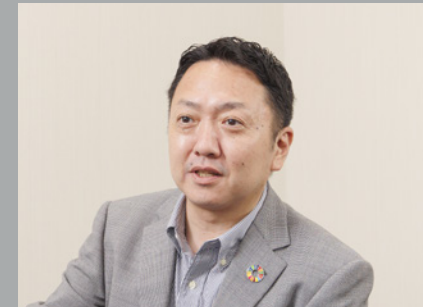
株式会社山梨中央銀行 総合事務部事務支援課主任調査役 (現・甲府北エリア 湯村支店・千塚支店 副支店長)