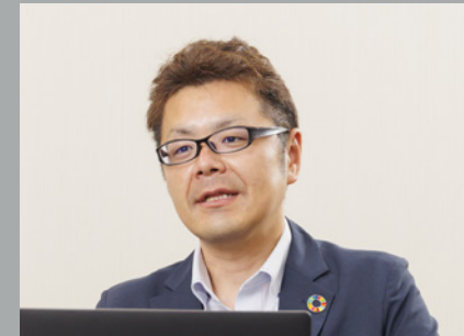
株式会社山梨中央銀行 システム統括部 システム開発課 課長代理

「液晶ペンタブレットの導入によりペーパーレス化と付随する業務の効率化が進展、当行が掲げる『事務ゼロ』へと大きく前進することができました」